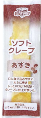
Azuki (Sweet Red Bean)