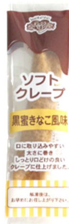
Brown Sugar Syrup & Kinako Flavor (Roasted Soybean Flour)