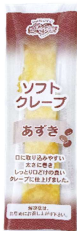
Azuki (Sweet Red Bean)