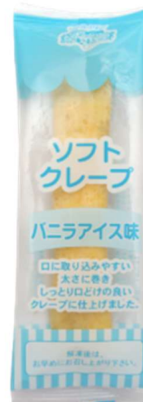
Vanilla Ice Cream Flavor