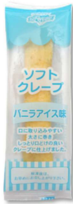
Vanilla Ice Cream