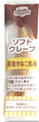
Brown Sugar Syrup & Kinako Flavor (Roasted Soybean Flour)