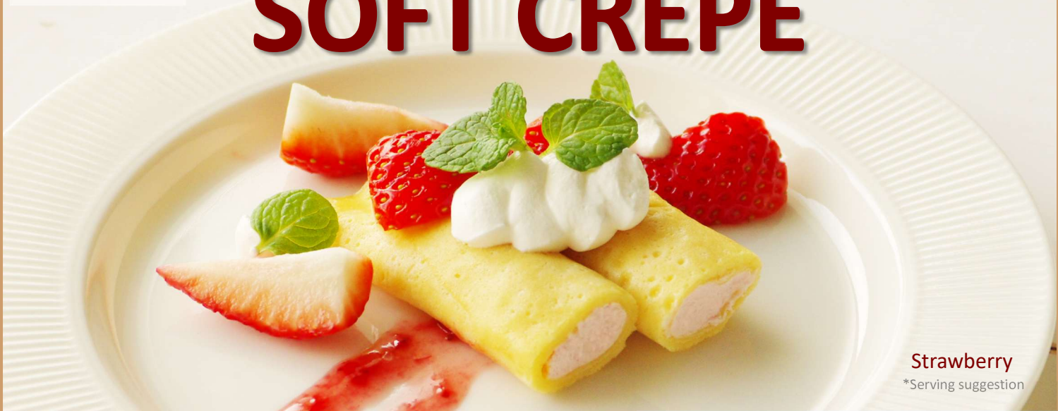
Strawberry *Serving suggestion