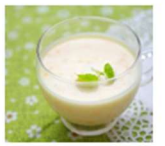
ヨーグルトや飲み物に混ぜてもおいしい♪