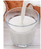
Nutrient Functional Food: Zinc