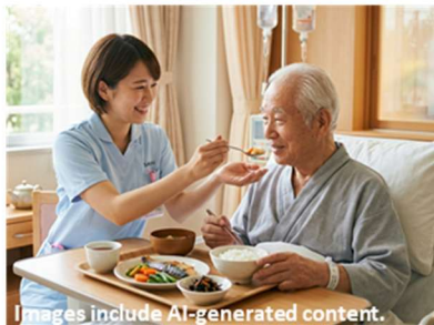
Images include AI-generated content.