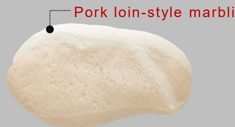
➤ Pork loin flavor