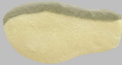
➤ Blue-backed fish taste