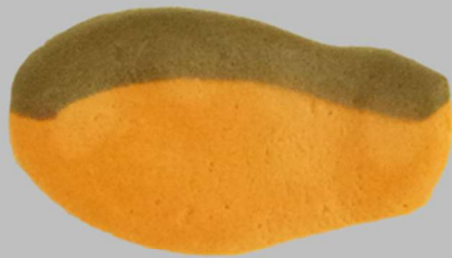
➤ Salmon taste

✓ Can be crushed with tongue ✓ Individual meal type