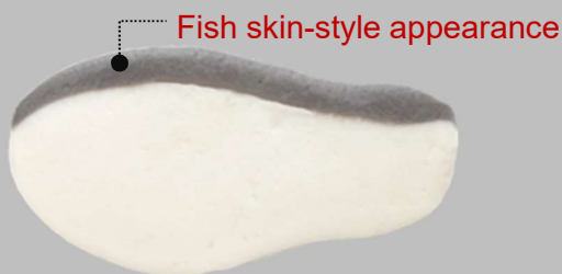
➤ White fish