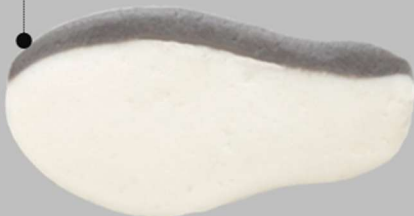
▶ White fish