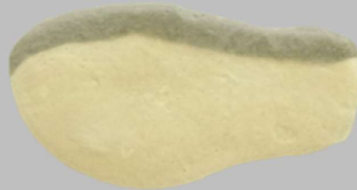
▶ Blue-backed fish taste