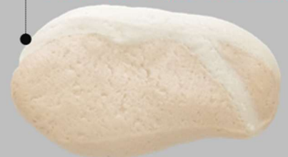
▶ Pork loin flavor

☞ A flavor that brings out the natural taste of ingredients and goes well with any dish.