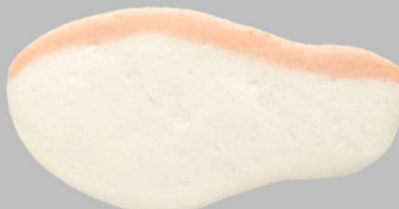
▶ Red perch flavor