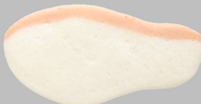
➤ Red perch flavor