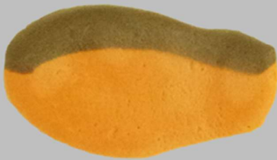
▶ Salmon taste