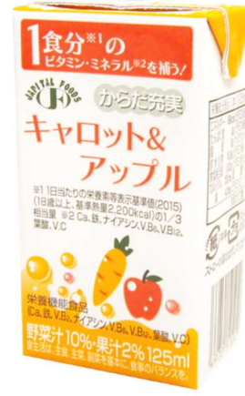
● キャロット&アップル