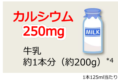
1日当たりの栄養素等表示基準値に対する充足率 (1本当たり)