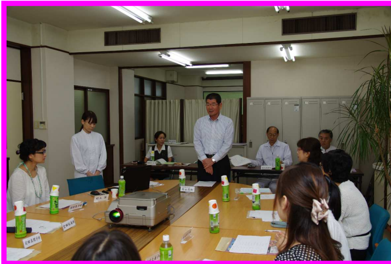
熊山社長よりご挨拶。