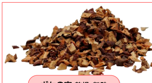
ボケの実 乾燥・粉砕