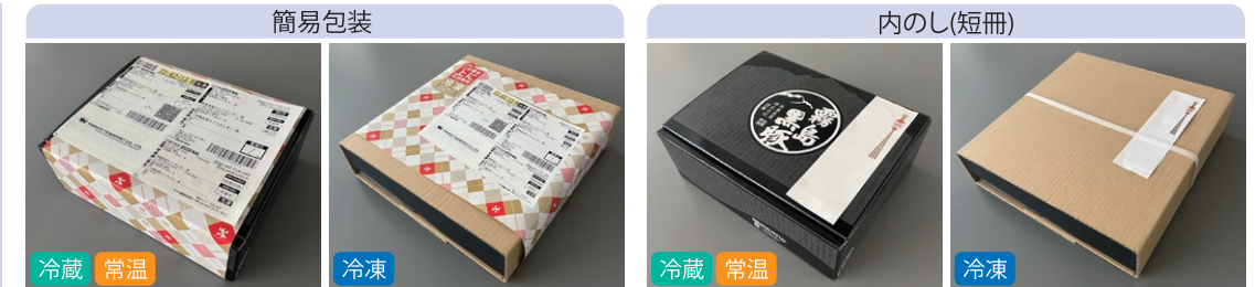
冷蔵・常温：ギフト箱に帯包装をかけ、宅配伝票を貼り付けます。 冷凍：ギフト箱を包んだスリーブに帯包装をかけ、宅配伝票を貼り付けます。

当社では環境保全のため、ご指定がない場合は簡易包装・中元のし(短冊/名入れなし)で発送いたします。