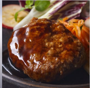
大人の照焼きソース