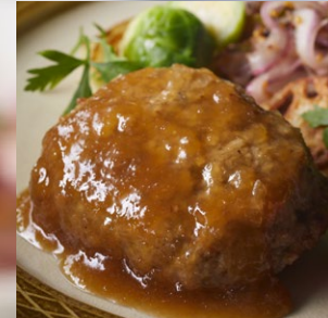
和風おろしソース